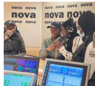
Radio NOVA, 2022 © NE