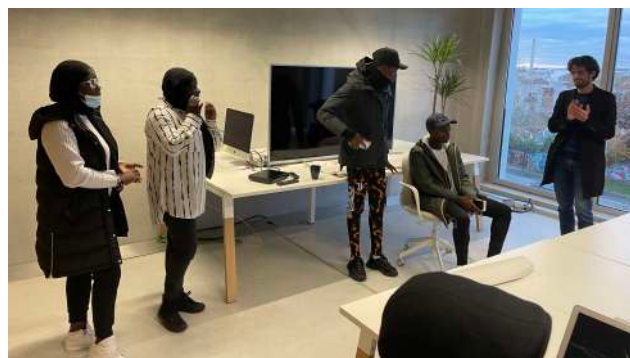
Pitch de concept de série devant la PROMO 1 2022