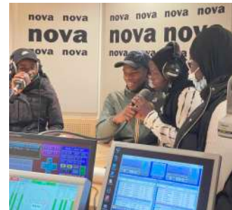
Radio NOVA, 2022 © NE